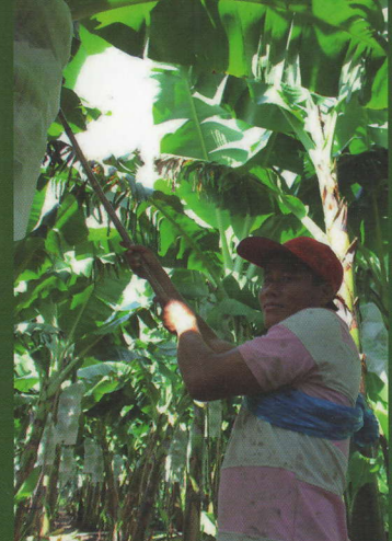
ກໍລະນີສຶກສາການປູກສາລິລ້ຽງສັດ, ມັນຕົ້ນ ແລະ ກ້ວຍ